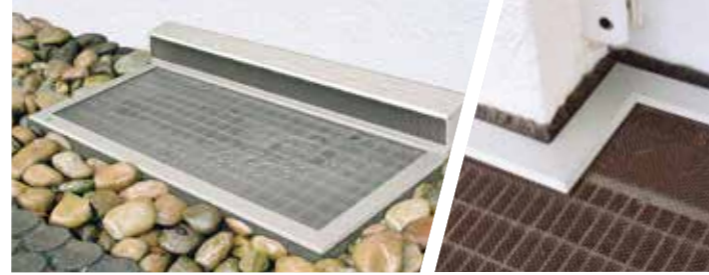
RESI bietet Regen- und Insektenschutz mit Belüftung. Das trittsichere Polycarbonat ist für eine lückenlose, stolperfreie Konstruktion mit dem Rost verschraubt.