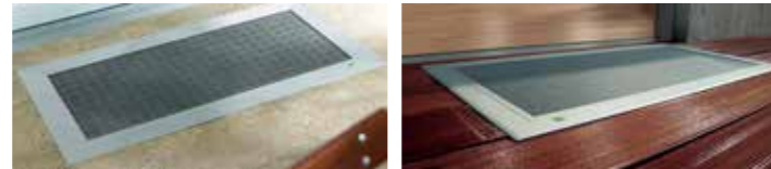
ELSA – Bei dem begehbaren und extrem witterungsbeständigen Ersatz aus Edelstahl oder Streckmetall ist der Gitterrost integriert. Sie ist mit Einbruchssicherung und gleichzeitiger Schnellentriegelung von innen lieferbar.