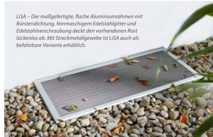
LiSA – Der maßgefertigte, flache Aluminiumrahmen mit Bürstendichtung, feinmaschigem Edelstahlgitter und Edelstahlverschraubung deckt den vorhandenen Rost lückenlos ab. Mit Streckmetallgewebe ist LiSA auch als befahrbare Variante erhältlich.