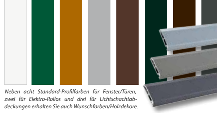
Neben acht Standard-Profillarfarben für Fenster/Türen, zwei für Elektro-Rollos und drei für Lichtschachtabdeckungen erhalten Sie auch Wunschfarben/Holzdekore.